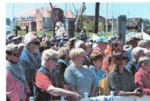
Viele wollten sich das Ereignis nicht entgehen lassen.