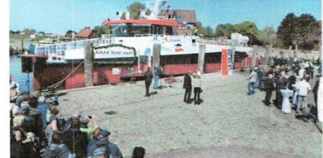
Seit dem 20. Mai ist der neue Katamaran im Einsatz.